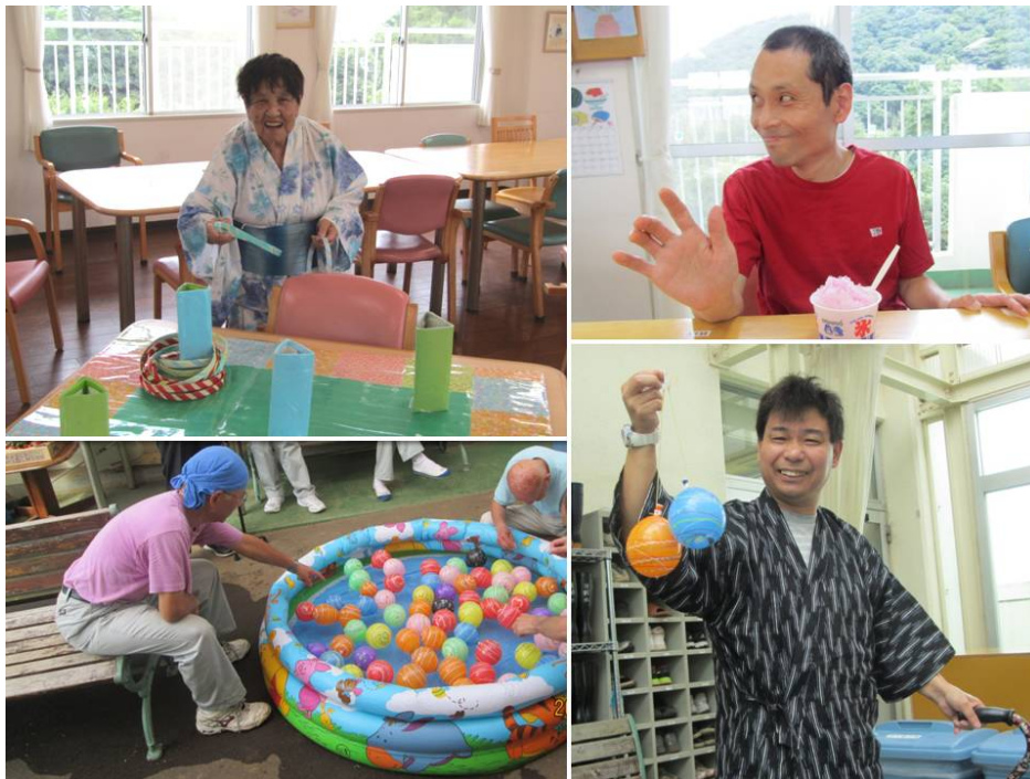
ヨーヨー釣りや輪投げ、かき氷をたのしみました。